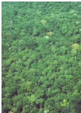
Tropisch FSC bos voor kap

De laatste jaren zien we dat 'commercieel gekende houtsoorten' zoals afrormosia, meranti, bangkirai of teak steeds schaarser worden, en dat het vaak vrij slecht gaat met de bossen van herkomst.